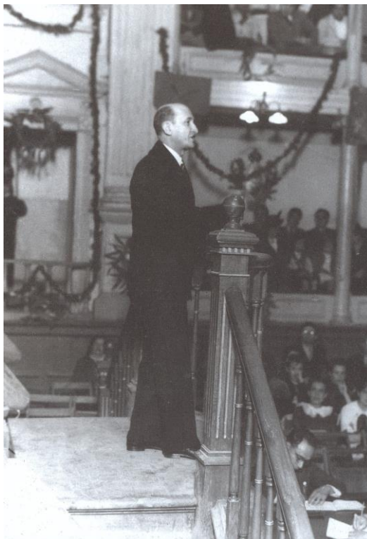
Ingeniero Félix F. Palavicini en la tribuna, hablando sobre el artículo 3o. constitucional. Historia gráfica del Congreso Constituyente 1916-1917... p. 70.