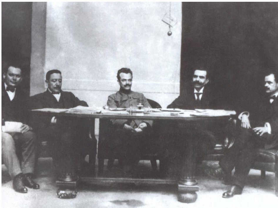
Segunda comisión de estudio de puntos constitucionales, en que figuró el general Francisco J. Múgica, miembro del ala radical del constituyente. Historia gráfica del Congreso Constituyente 1916-1917... p. 38.