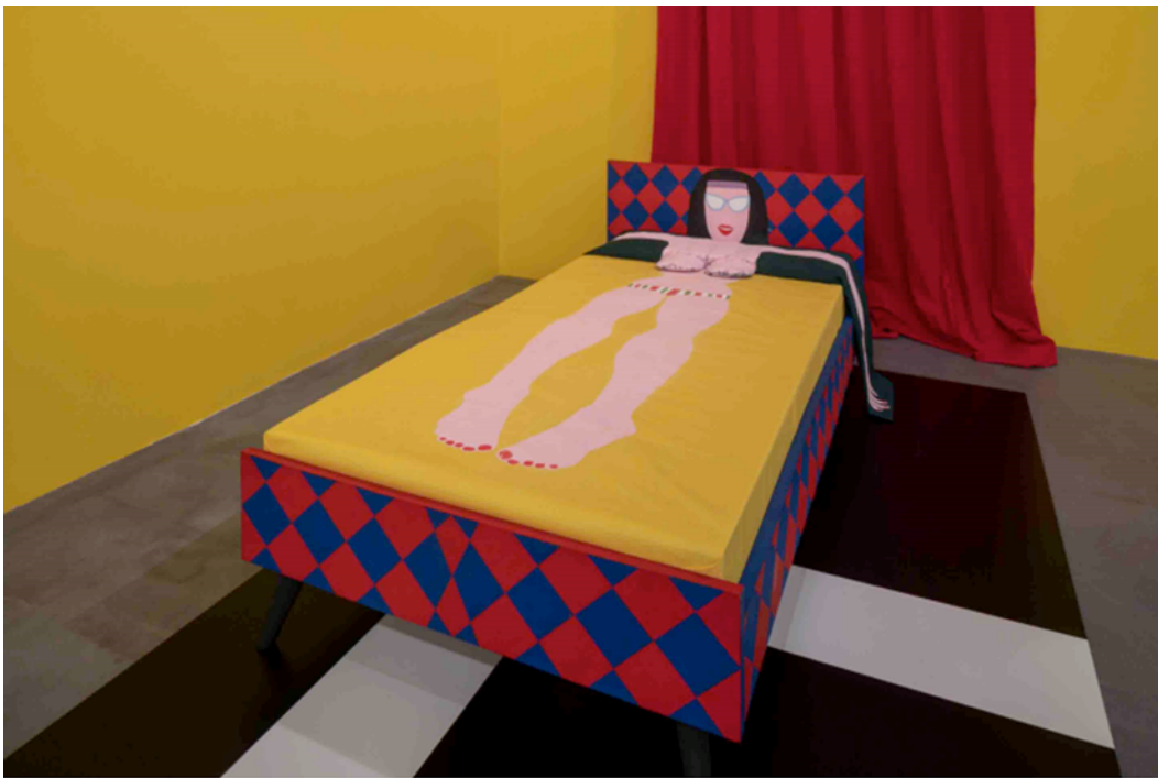
Teresa Burga, 1967. Técnica mista, dimensões variáveis. Obra restaurada em 2007.

O corpo foi representado de acordo com os ideais de beleza da época, largamente anunciados pelos meios de comunicação: ela é magra, tem os seios grandes, que estão em alto relevo, as unhas dos pés e das mãos pintadas de vermelho, e a boca com um batom na mesma