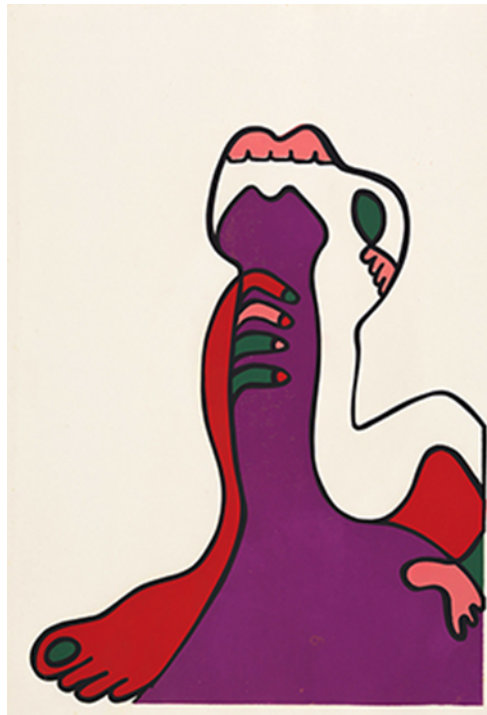
Imagem 1 – Ele e ela

Teresinha Soares, da série Homenagem a Caetano Veloso , 1968. Serigrafia sobre papel, 47 x 32 cm. Coleção da artista, Belo Horizonte.