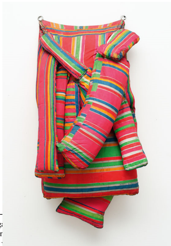
Imagem 7 - Colchón (Eróticos en tecnicolor)

Minujín também produziu diversos ambientes e instalações que utilizavam colchões e camas. Obras como Colchón (Eróticos en tecnicolor) [imagem 7], de 1964, e ¡Revuélquese y viva! 14 (Role e viva!) [imagem 8], do mesmo ano, foram construídas em tecido preenchido com espuma e pintado em cores fortes, que formavam as listras características dos colchões da época. O uso de colchões, que fazem referência a situações de intimidade, como descanso e sexo, convidava o público a interagir com as obras. Muitas produções de Minujín, assim como as de Teresinha Soares, incentivavam essa participação direta do público e buscavam conectar arte e vida. De maneira muito semelhante a Soares, Minujín destaca que nas camas e “nos colchões passamos mais da metade das nossas vidas. Nascemos, dormimos, fazemos amor, e até nos podem matar” (MINUJÍN, 2021, s/n) 15 .