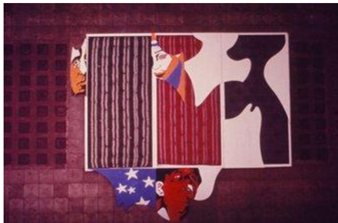
Imagem 6 - Ela me deu bola (Camas)

A obra abordava, assim, representações aceitas da feminilidade e da masculinidade. De um lado, as abas representavam o futebol, considerado na época como um espaço exclusivamente masculino, com seus ídolos celebrados como heróis nacionais. De outro, apresentavam a figura da mulher, normalmente representada em conexão com o espaço doméstico, representado pelas camas, ou hipersexualizada e objetificada, em poses sensuais, como as retratadas na obra.